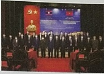
Bìa 1: Tổng Bí thư, Chủ tịch Nước Lào Thoonglun Xixulít và Chủ tịch Nước Nguyễn Xuân Phúc cùng Đoàn đại biểu cấp cao hai nước chụp ảnh chung với Ban Giám đốc Học viện